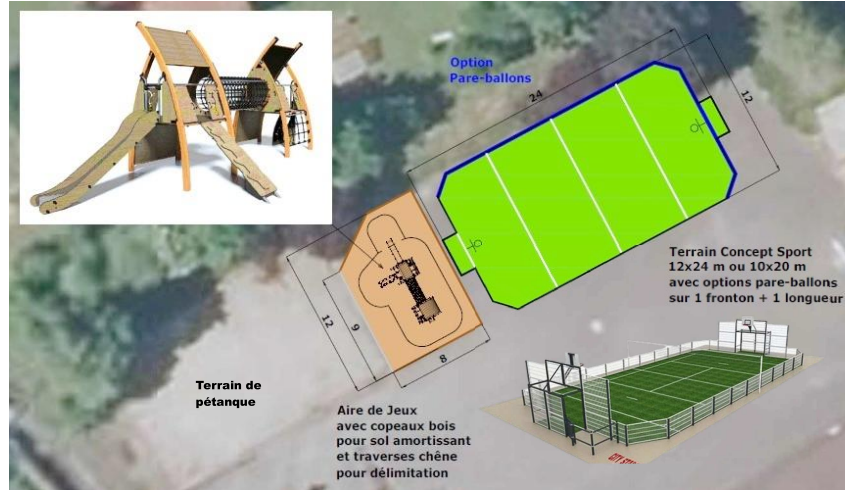
Projet d'installation à la salle des fêtes (exemple)

Le village s'est inscrit au concours des villes et villages fleuris cette année. Nous encourageons toutes les personnes qui le souhaitent à participer à son embellissement !